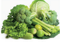
Yeşil yapraklı sebzeler (ispanak, karalahana, hardal)